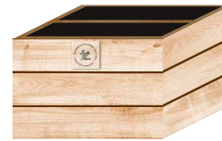
Abschlussmodul (zwei Wannens auf einer Ebene)