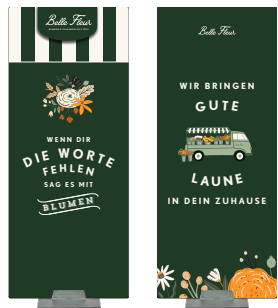
Bodenaufsteller Vorder- und Rückseite