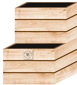
Basismodul klein (zwei Wannens auf zwei Ebenen)