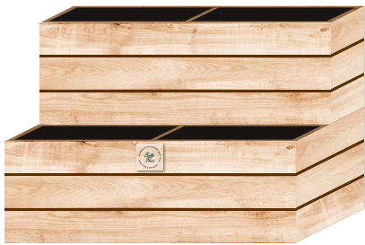
Basismodul (vier Wannens auf zwei Ebenen)