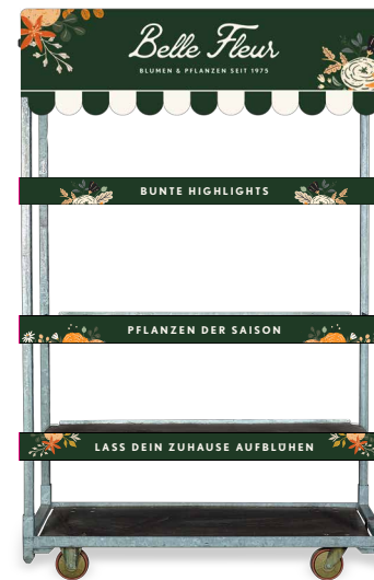
Verkleidete CC-Karre (vier Lagen)