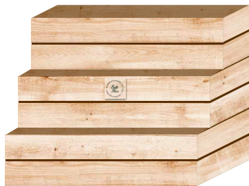
Schnittblumentreppe (drei Ebenen)