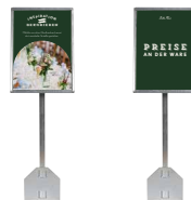
Tischauflsteller mit austauschbarem DIN-A4-Schild