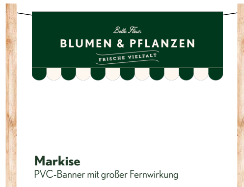
Markise PVC-Banner mit großer Fernwirkung